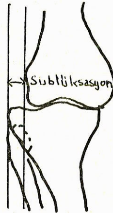
Şekil 2 : Lateral femoral kondilin lateralinden çizilen bir çizgi ile lateral tibial kondilin lateralinden buna paralel çizilen ikinci bir çizginin arası mm. cinsinden ölçülerek sublüksasyon hesaplanır.