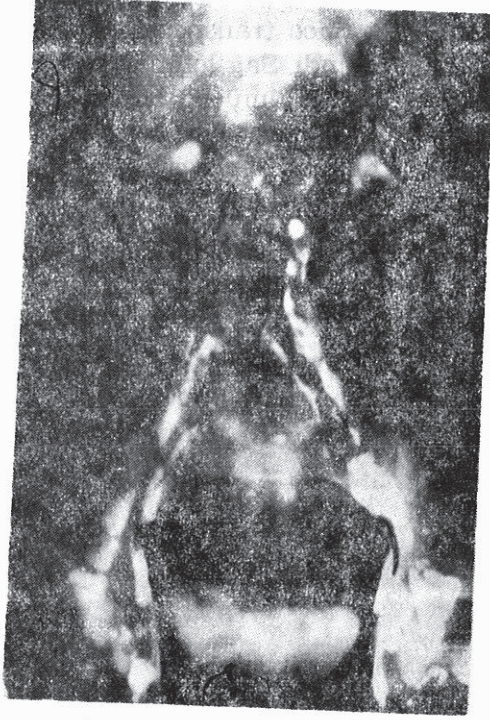
Şekil III : İlk operasyondan 45 gün sonra Bigedal levfongiografide renal hilus seviyesi üzerinde lenf akımından obstrüksiyon ve tüm böbrek kapsülü çevresince lenfatik kaçak