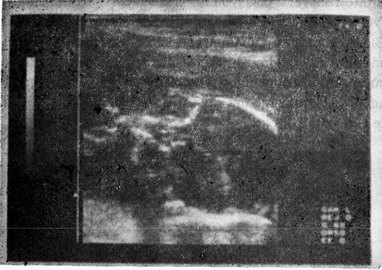
Şekil 2 : Oksiput posterior pozisyonda OO ve II mesafelerinin ölçümü

Gebelik haftasının belirlenmesinde BPD, OO ve II nun, BPD'nin tahmininde ise OO ve II nun ayrı ayrı ve beraberce rollerini saptamak için basit ikili ve çoklu regresyon uygulandı. Tek tek mi yoksa beraberce mi daha başarılı sonuçlar verdiklerini saptamak için r , R^2 ve SS değerleri hesaplandı.