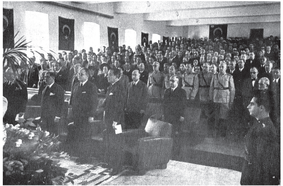
Şekil 1. Ankara Tıp Fakültesi'nin açılış töreni 19.10.1945.

Sonunda Ankara Tıp Fakültesi 19 Ekim 1945 tarihinde 2. Cumhurbaşkanı rahmetli İsmet İnönü'nün